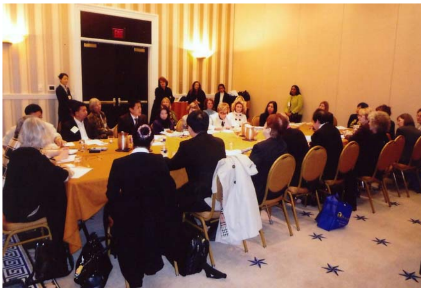
<GSA の Interest Group on the Elder Abuse, Neglect, and Exploitation の会場の様子>